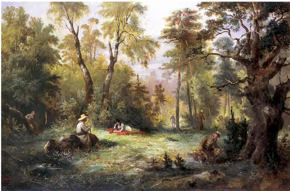
Grzybobranie ilustracja do III księgi Pana Tadeusza autorstwa Franciszka Kostrzewskiego z 1860