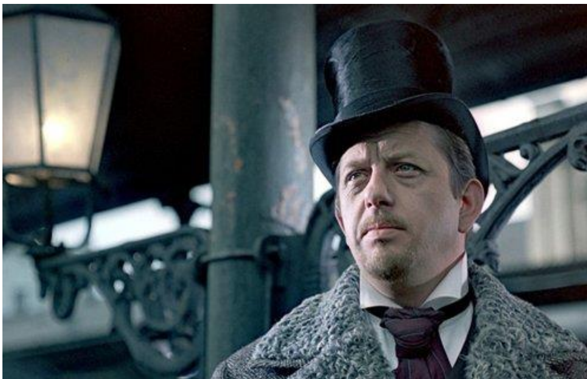
Kadr z filmu Lalka reż. Wojciech Has, 1968

Naturalizm powieści – odnajdujemy w opisach życia biedoty (np. spacer Wokulskiego po Powiślu).